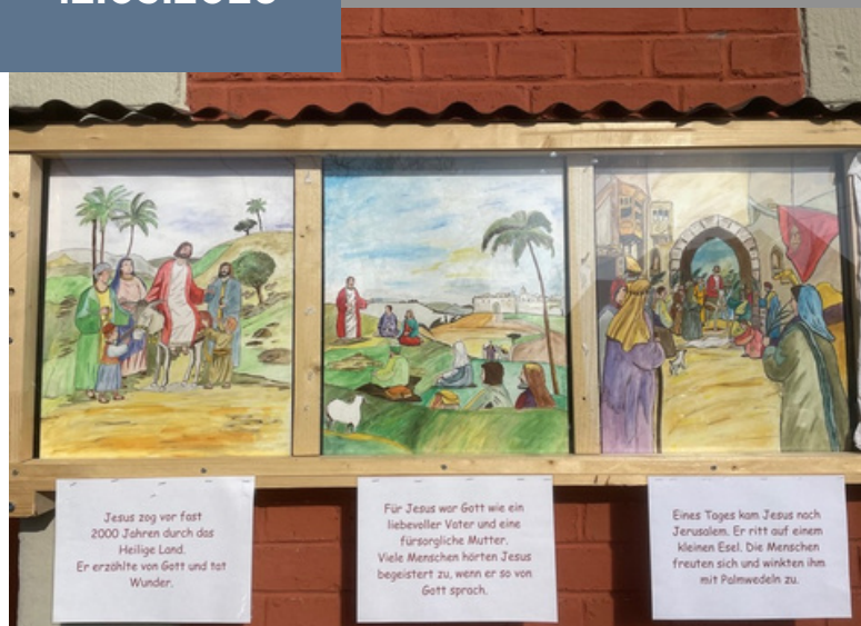
Szenen aus Kreuzweg von Ralf Schmid (Nachbarhaus der Kirche in Raidwangen)