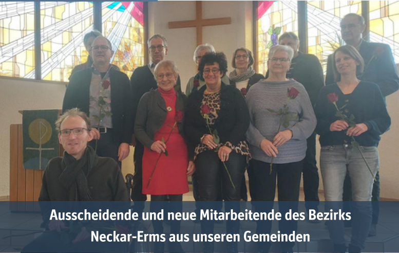
Ausscheidende und neue Mitarbeitende des Bezirks Neckar-Erms aus unseren Gemeinden